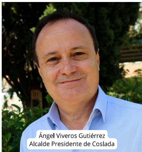
Ángel Viveros Gutiérrez Alcalde Presidente de Coslada